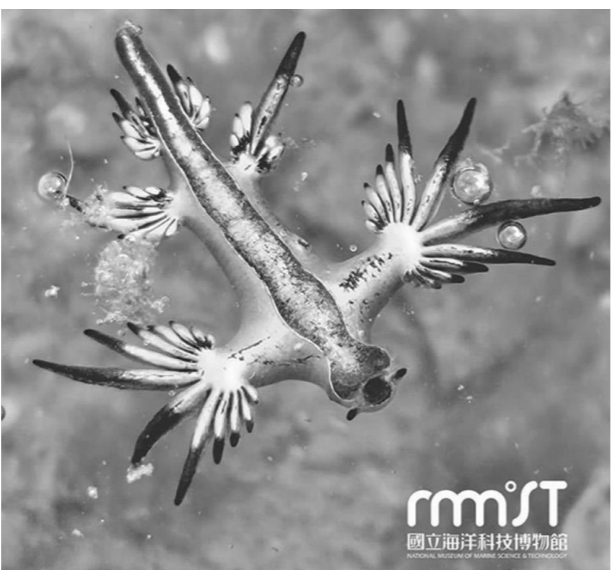
海神貼心提醒你，完成後記得多檢查幾次！

請問關於海蛞蝓的描述，下列哪一項文章中並沒有提到？ ①海蛞蝓的顏色。 ②海蛞蝓的食物。 ③海蛞蝓主要的分布地區。 ④海蛞蝓的種類與數量。